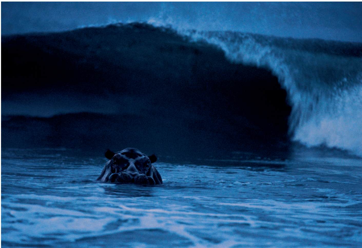
Hipopótamo surfista clicado por Michael Nichols no Parque Nacional de Loango, no Gabão; abaixo, uma jovem tigresa surpreendida no Parque Nacional de Bandhavgarh, na Índia