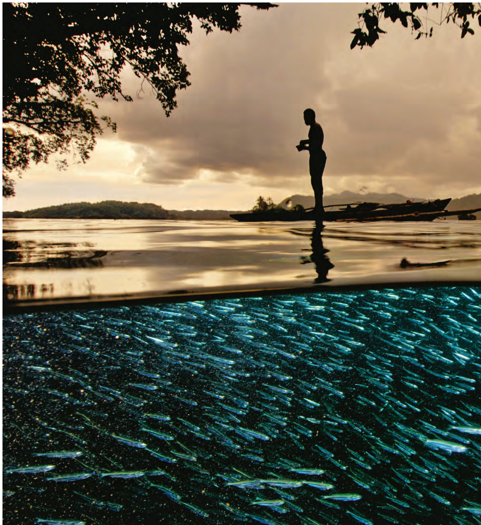
Foto de beleza impressionante feita por David Doubilet mostra um pescador no estreito Dampier, Indonésia, em sua canoa, enquanto um cardume faiscante passa por baixo dele